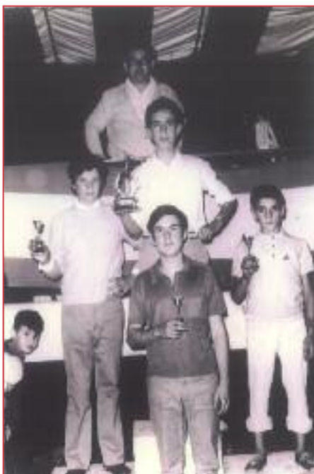
Concurso pasabolo Peña Revilla 1972 (juveniles/infantiles).

En fin, este verano o lo que queda de él, voy a intentar recuperar la magia y el ocio de otros tiempos animando a mis colegas de siempre; practicaremos con canicas, fabricaremos unas piraguas en miniatura y jugaremos unas partidas al fútbolín, aunque no estoy seguro de poder conseguirlo. Los desafíos con las chapas y tapones lo dejaremos para el verano que viene, porque el inicio del nuevo curso nos espera a la vuelta de la esquina. No sé, pero creo que he tenido un sueño profundo de mi niñez, en una noche calurosa de verano, y acabo de despertar.