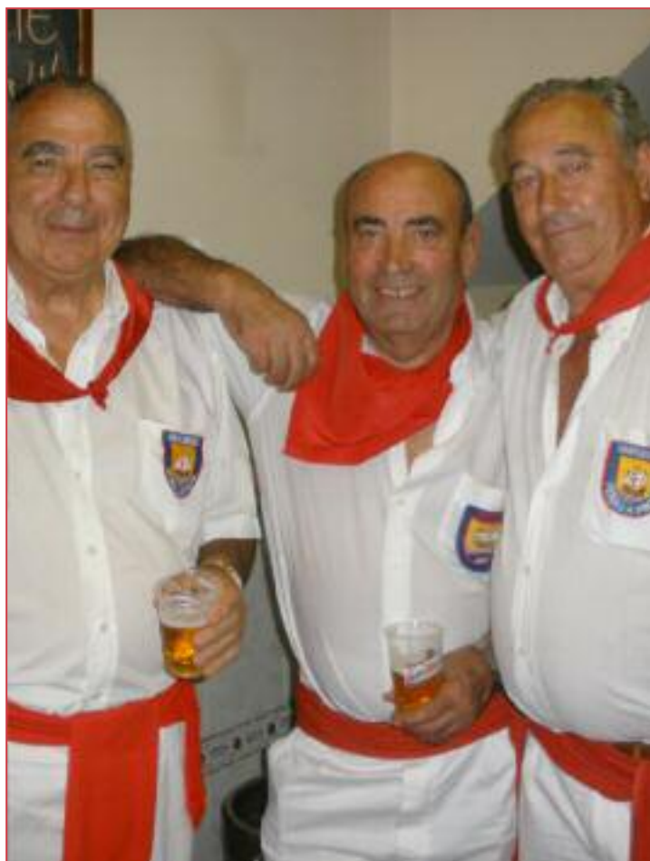
La vieja guardia.