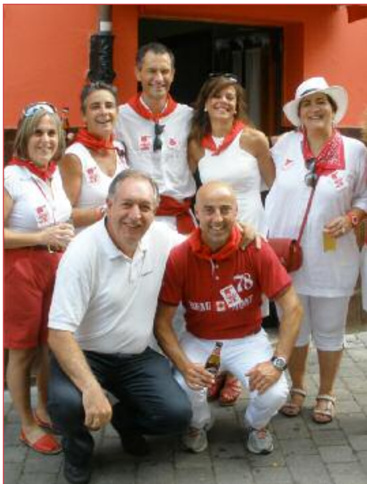
Los ángeles de la guarda con los amigos del Bar Inglés.