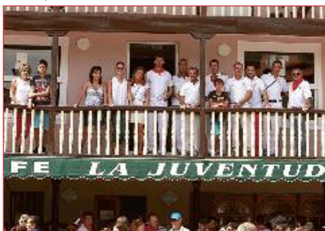
Arriba la Juventud.