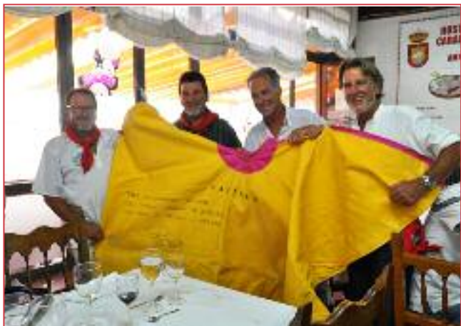
Los Tarzán al limón.