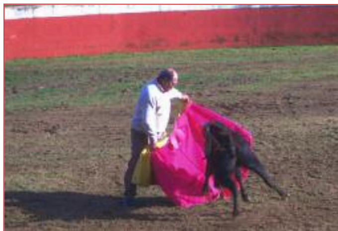
Y así torea todavía El Fino. Lanceando en la finca de El Juli.