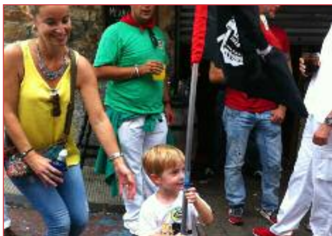
El niño pirata.