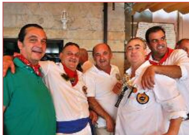
Trapío de primera.