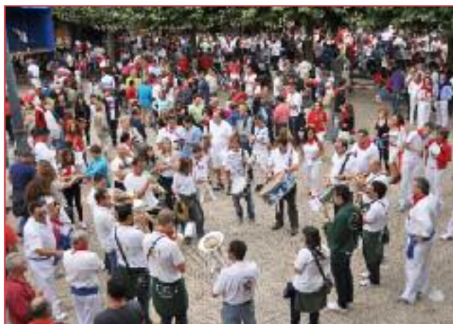
La txaranga alavesa.