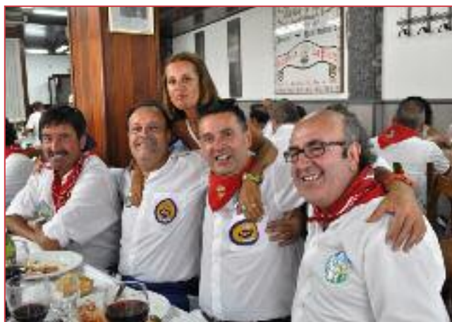
Busque y compare.