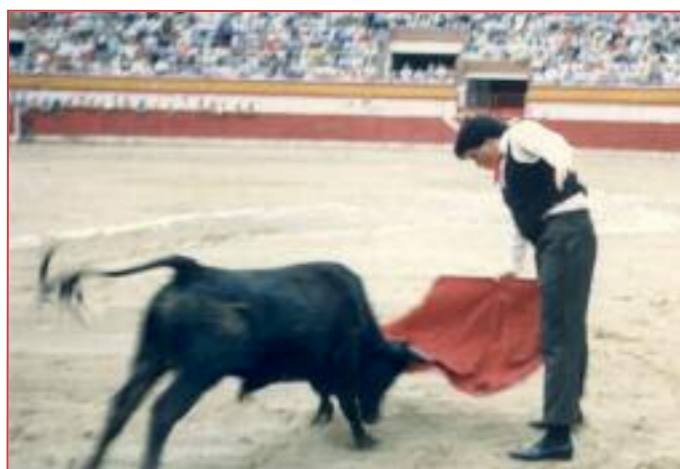
El secretario de La Encerrona también hizo sus pinitos. En una becerrada de las peñas en los años 80.