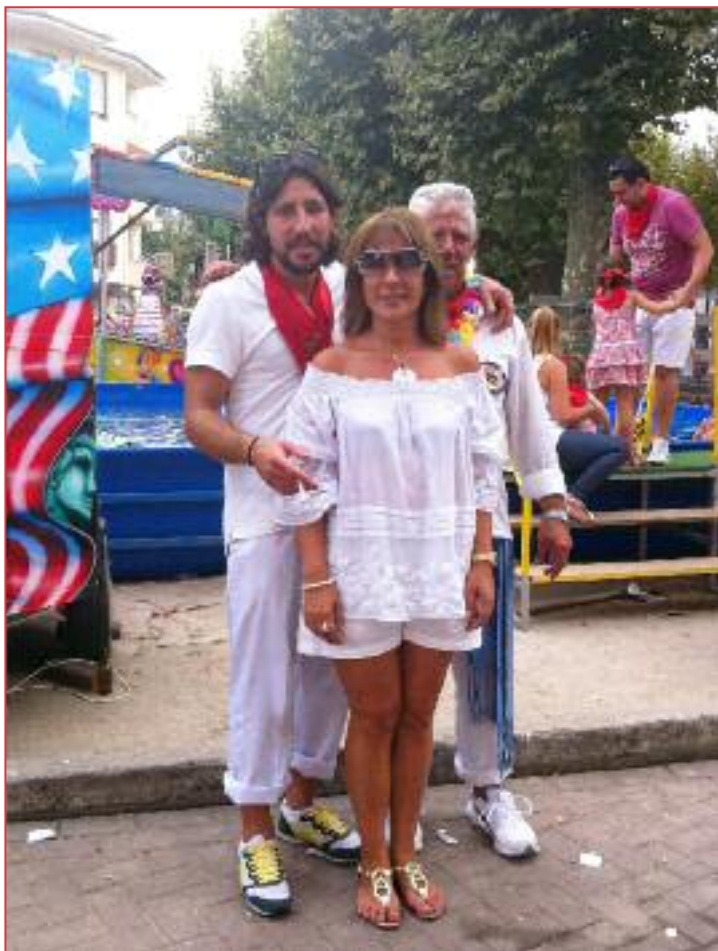
Pipo y familia.