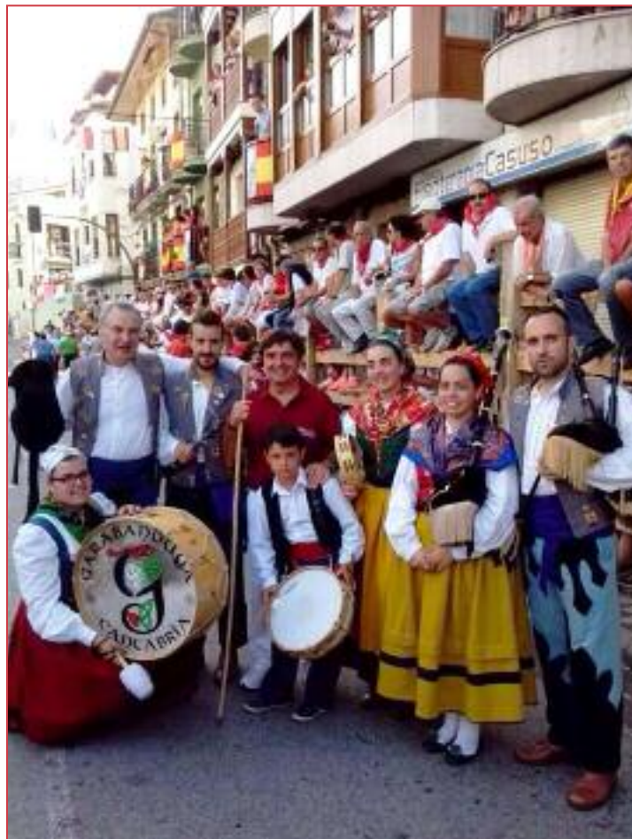
Reta con los gaiteros.