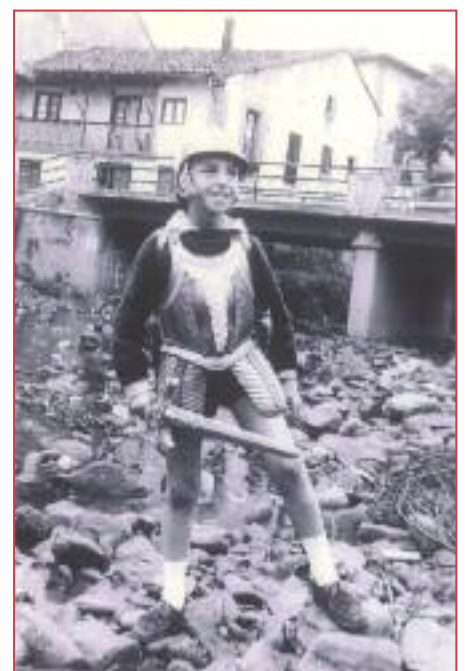
Agitador de marmajuelas con armadura en el Vallino.

Otras actividades -de alto riesgo- que poníamos en práctica llegada la primavera, aunque poco éticas, suponía encaramarse a los árboles y alcanzar las ramas de los cerezos desde los lugares más insólitos, embolsándonos cantidades ingentes de cerezas, dado que no disponíamos de tiempo para degustar in situ tan succulento manjar. El robar cerezas era una prueba de valor que practicábamos en aquellos tiempos, no sé bien el porqué de esta diversión, al tener que sortear a los guardeses y sabuesos que custodiaban las fincas. Nuestro lugar preferido para "el asalto" era desde el muro del