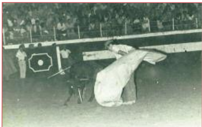
Así toreaba de capa Jaime del Río «El Fino». Remate garboso a pies juntos en la vieja plaza de La Nogalera.